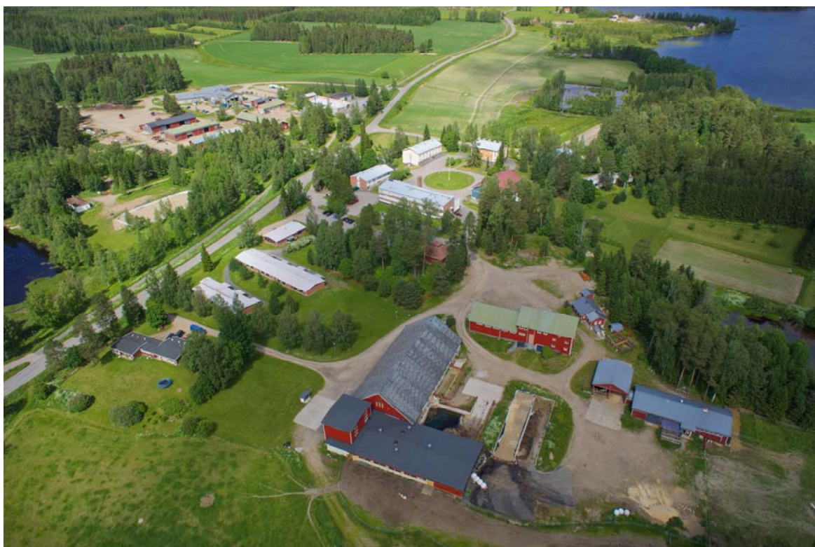
Kuva 2. Viistoilmakuva Tarvaalan maatalousoppilaitoksen alueesta (Kuva: JAMK).

Asemakaavoituksella huomioidaan myös tulevaisuuden tarpeet. Lisäksi kaavoituksessa huomioidaan ajoväylät, liittymät, vesi- ja viemäriinjat, tekniset rakennelmat sekä laitteet, mahdolliset kaukolämpölinjat ja sähkölinjat. Suunnittelussa huomioidaan vesistöjen läheisyys, rantavyöhykkeen suunnittelu, ranta-alueiden erityiset kehitystarpeet, Tarvaalan alueen merkittävät maisema- ja kulttuurimaisemaympäristöt ja kohteet sekä kaikkien toimintojen vaikutus lähi- vesistöihin ja maisemaan.