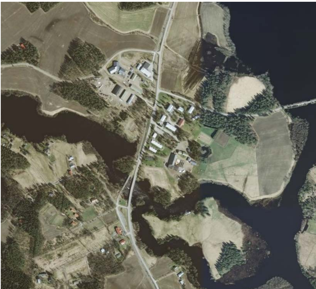
Kuva 1. Ortoilmakuva suunnittelualueesta.

Asemakaavoitus koskee tiloja Tarvaala 729-408-4-80 ja Luonnosvarainstituutti 729-408-4-84. Kaavoitettavan alueen läpi kulkee Uurainen-Saarijärvi yhdystie. Alueen eteläpuolella virtaa Majakoski, joka laskee myös alueen eteläpuolta rajaavasta Kallinjärvestä suunnittelualueen itäpuolella sijaitsevaan Summasjärveen.